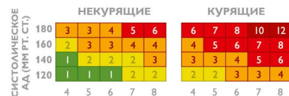
ОБЩИЙ ХОЛЕСТЕРИН ШКАЛА ОТНОСИТЕЛЬНОГО РИСКА

Для людей моложе 40 лет рекомендуется пользоваться Шкалой относительного риска . Шкала используется безотносительно пола и возраста человека и учитывает три фактора: систолическое (верхнее) артериальное давление, уровень общего холестерина и факт курения . Технология ее использования аналогична таковой для основной Шкалы SCORE.